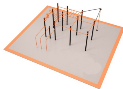
б) стационарный КСС БК