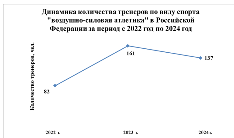
График № 2

В графике № 2 представлена динамика количества тренеров (тренеров-преподавателей) с учетом сведений федеральных статистических наблюдений (форма № 1-ФК).